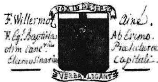
Blazonul, numele cavaleresc și deviza lui Willermoz